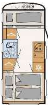
c'go up 465 KR