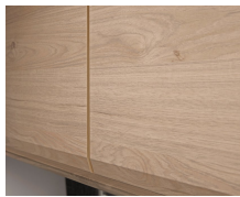
+ Möbeldekor Noce Nagano