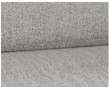
+ Wohnwelt Samir