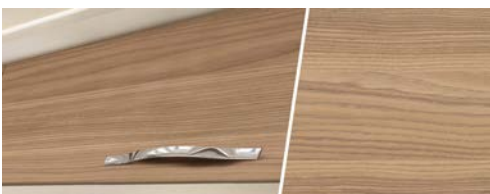
+ Holzdekor Ashton